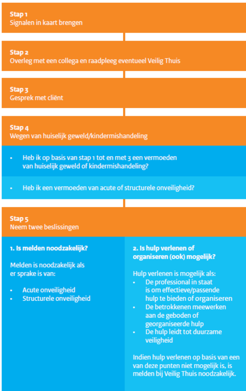
Figuur 1: Stappenplan verbeterde meldcode

Het nieuwe stappenplan ziet er als volgt uit: